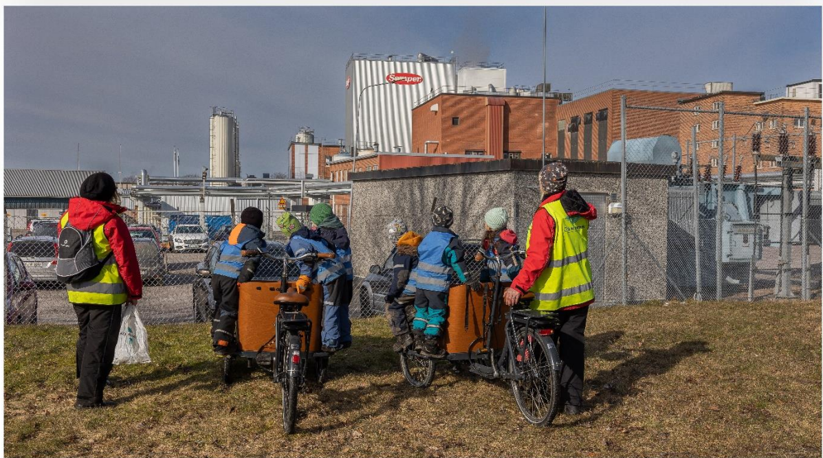
Semper Biosfärstråk